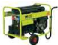
Kit de transporte Otras opciones a pag. 49

Su bancada tubular y rígida, robusta y a su vez ligera, proporciona la protección necesaria a la motosoldadora y facilita su transporte.